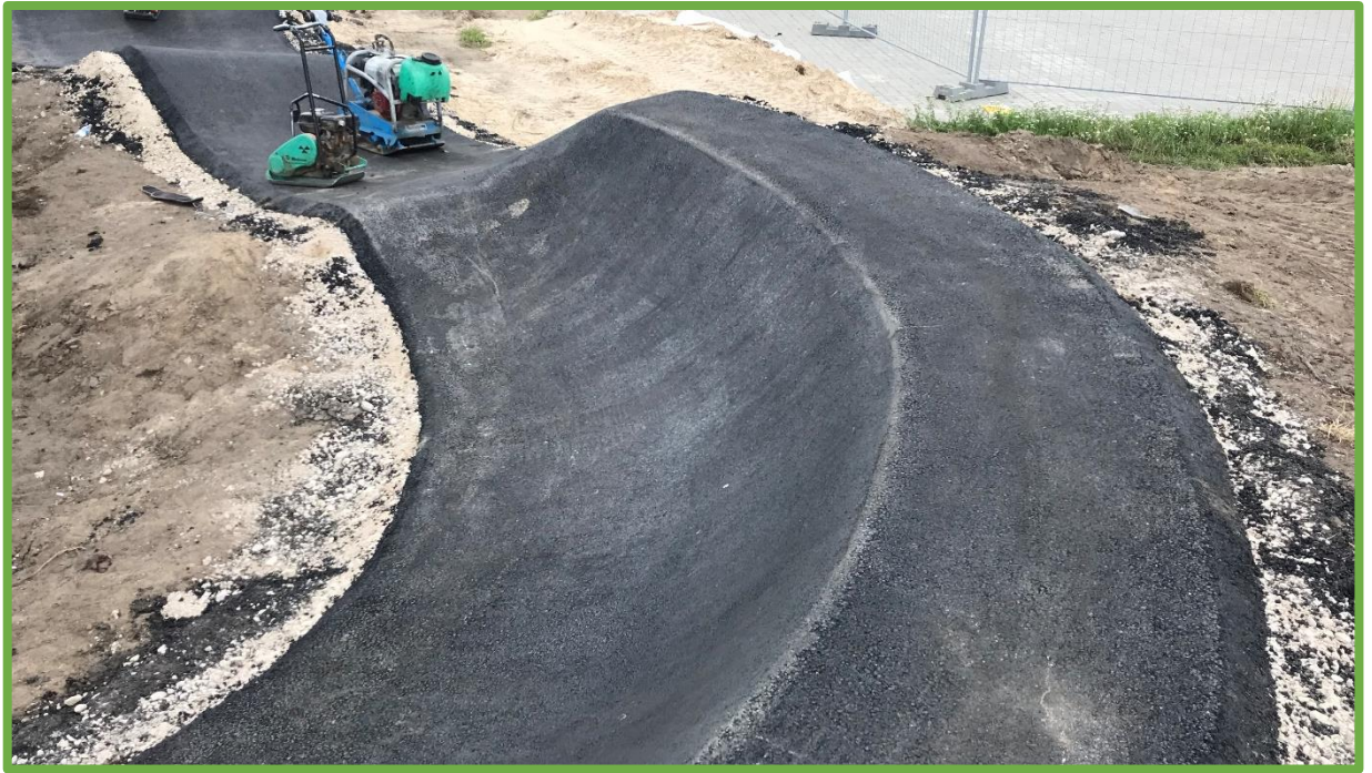
Prawidłowo wykonana nawierzchnia asfaltowa – jednorodna i gładka.

Wszystkie przeszkody wchodzące w skład rowerowego placu zabaw - PUMPTRACK (garby, muldy, przeszkody złożone itp.) muszą być wyprofilowane w taki sposób, aby umożliwiała płynną jazdę. Niedopuszczalne jest wyprofilowanie przeszkód wymuszających "nerwową jazdę" tzn. zbyt ostrych, o szpiczastych kształtach.