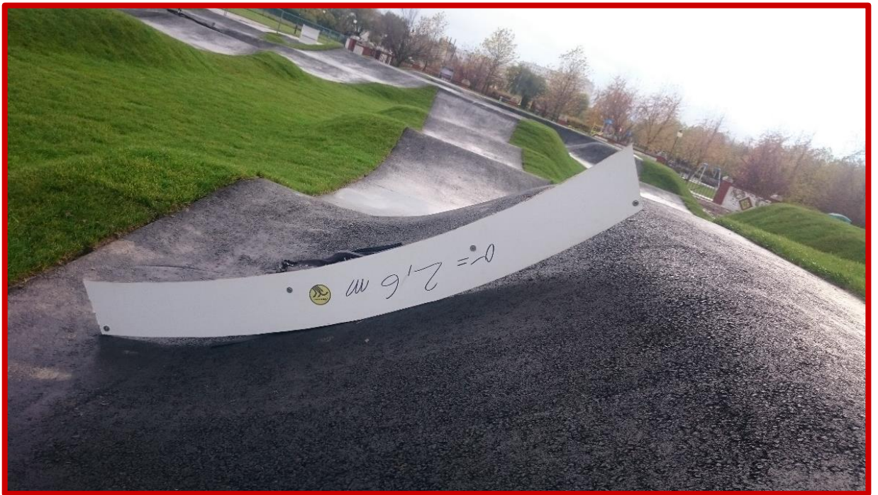
Nieprawidłowo wykonany zakręt profilowany, którego przekrój nie stanowi wycinka koła.

Warstwa jezdna wszystkich zakrętów musi być w przekroju wycinkiem koła o promieniu nie większym niż 2,6 metra. Niedopuszczalne jest stosowanie zakrętów profilowanych (tzw. band), które są w przekroju płaskie lub ich promień jest niejednostajny. Wyjątek stanowi dolna półka bandy, która może być wypłaszczona.