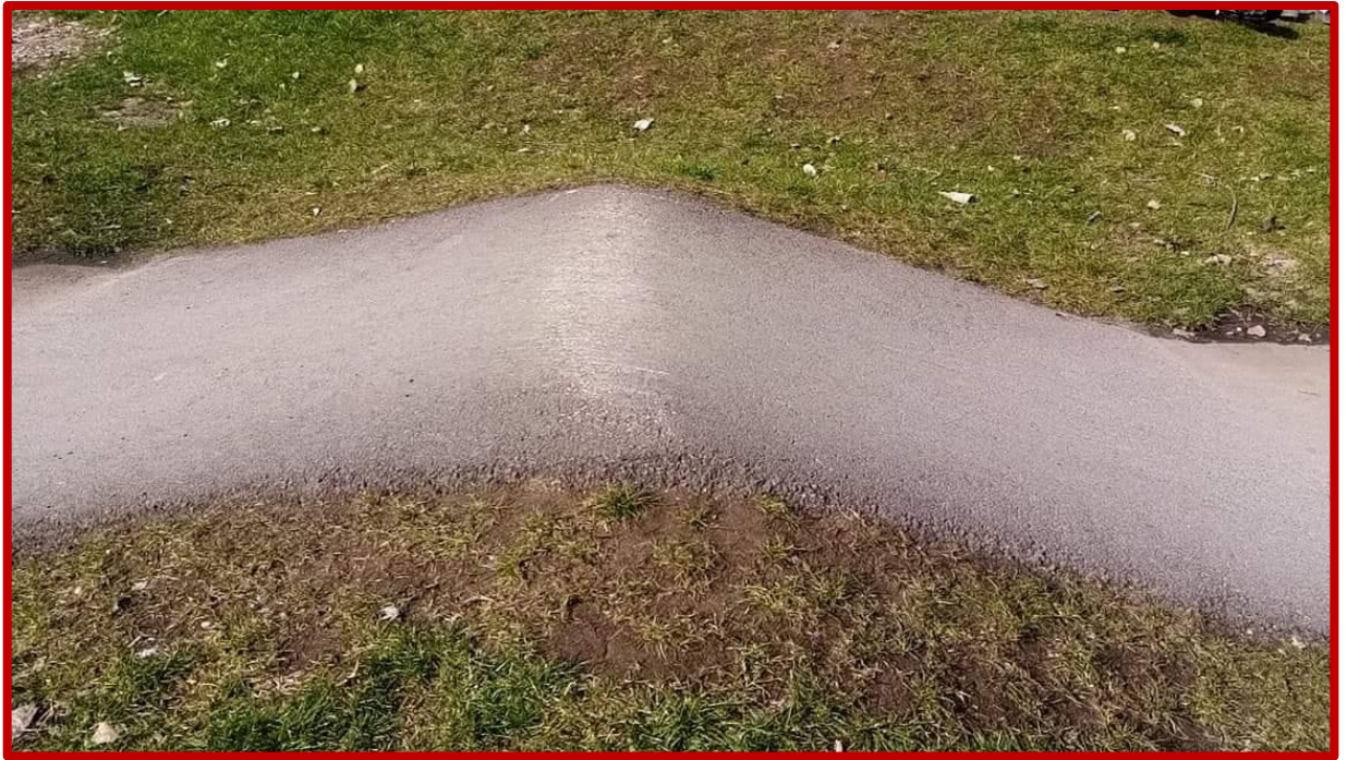
Niepoprawnie wyprofilowany garb – podjazd i zjazd płaski, szpiczasty kształt przeszkody