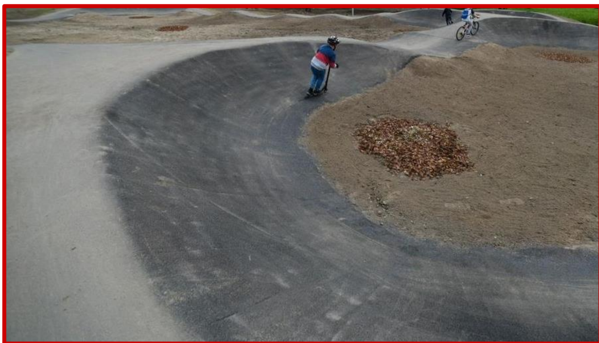
Nieprawidłowo wykonany zakręt o niejednostajnym promieniu, bez wypłaszczonej dolnej półki oraz niebędący w przekroju wycinkiem koła.