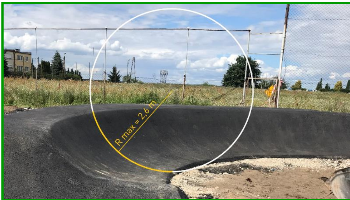
Prawidłowo wykonany zakręt profilowany, którego przekrój stanowi wycinek koła.