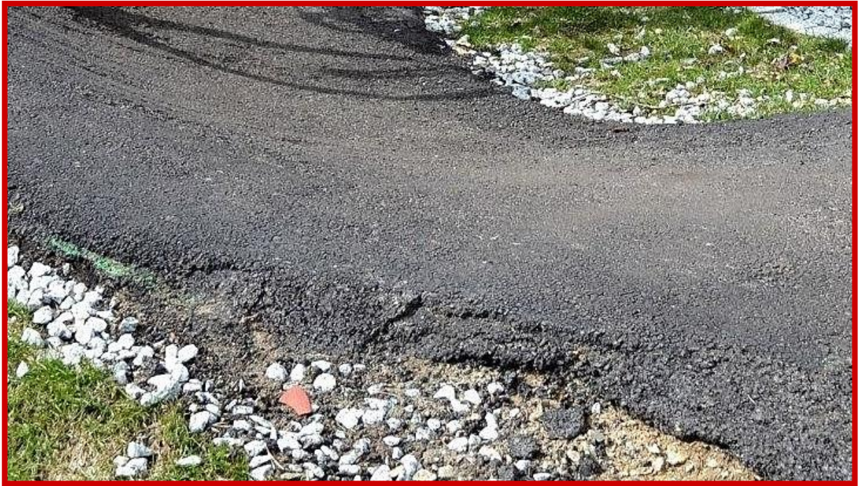
Nieprawidłowe wykończenie krawędzi nawierzchni jezdnej – nierówne, bez fazowania, z ubytkami i pęknięciami.