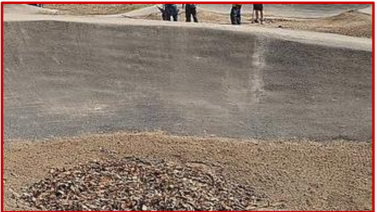
Nieprawidłowe połączenie nawierzchni jezdnej w miejscu przerwy technologicznej

Połączenia nawierzchni jezdnej w miejscach przerw technologicznych muszą być tak wykonane, aby nie były wyczuwalne uskoki ani zmiany profilu przeszkody.