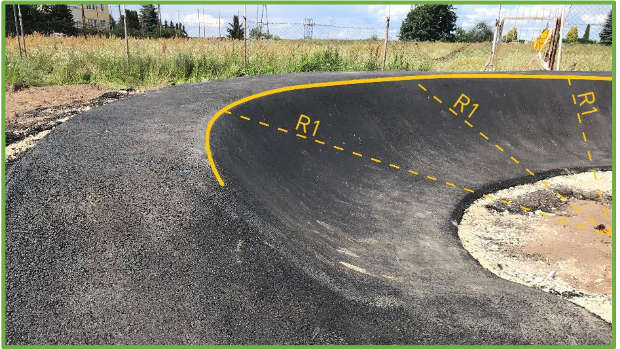
Prawidłowo wykonany zakręt profilowany – o jednostajnym promieniu zakrętu