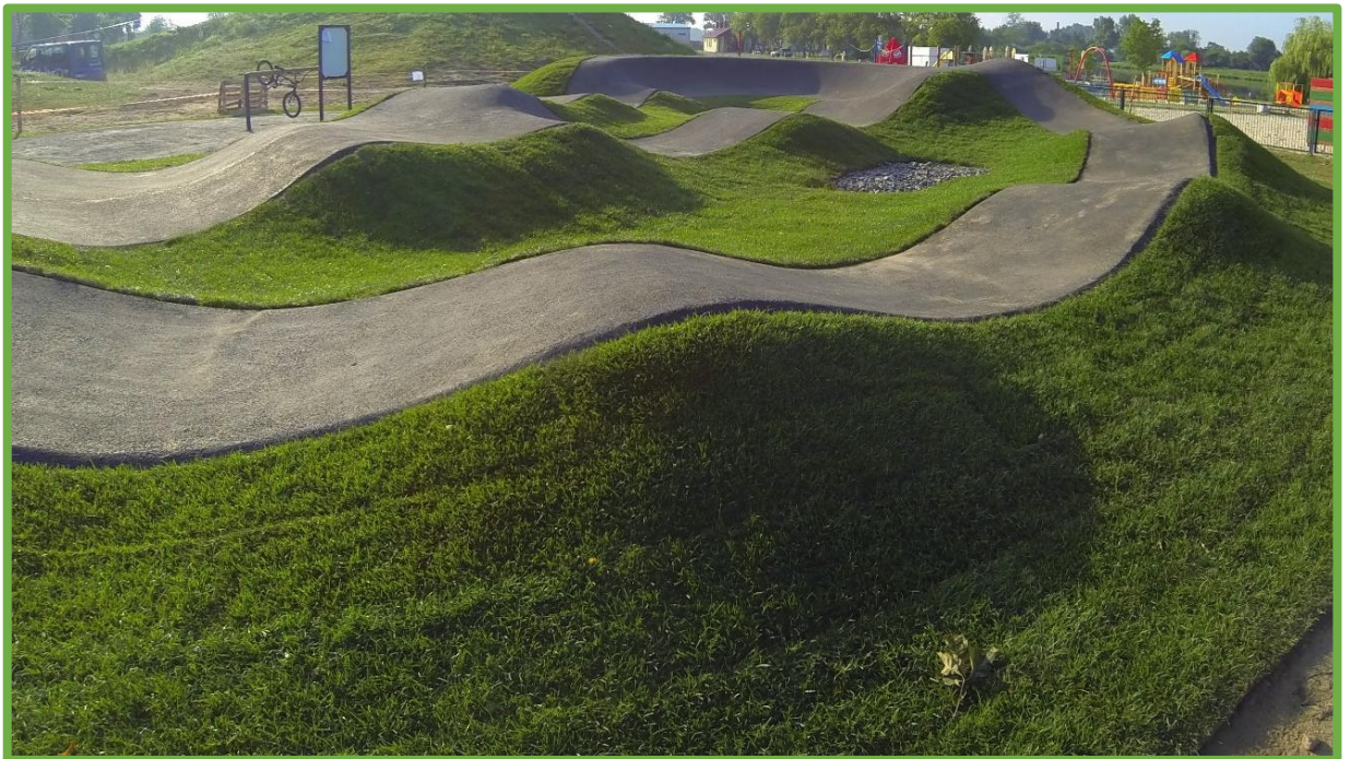
Garby o prawidłowo wyprofilowanych kształtach

Wszystkie krawędzie warstwy jezdnej muszą być sfazowane pod kątem 45^{\circ} ( \pm 5^{\circ} ). Fazowanie i zagęszczanie krawędzi musi odbywać się podczas układania warstwy. Niedopuszczalne jest fazowanie (cięcie) po wystygnięciu masy mineralno-asfaltowej. Krawędzie muszą być wykonane w równej linii, bez pęknięć i ubytków.