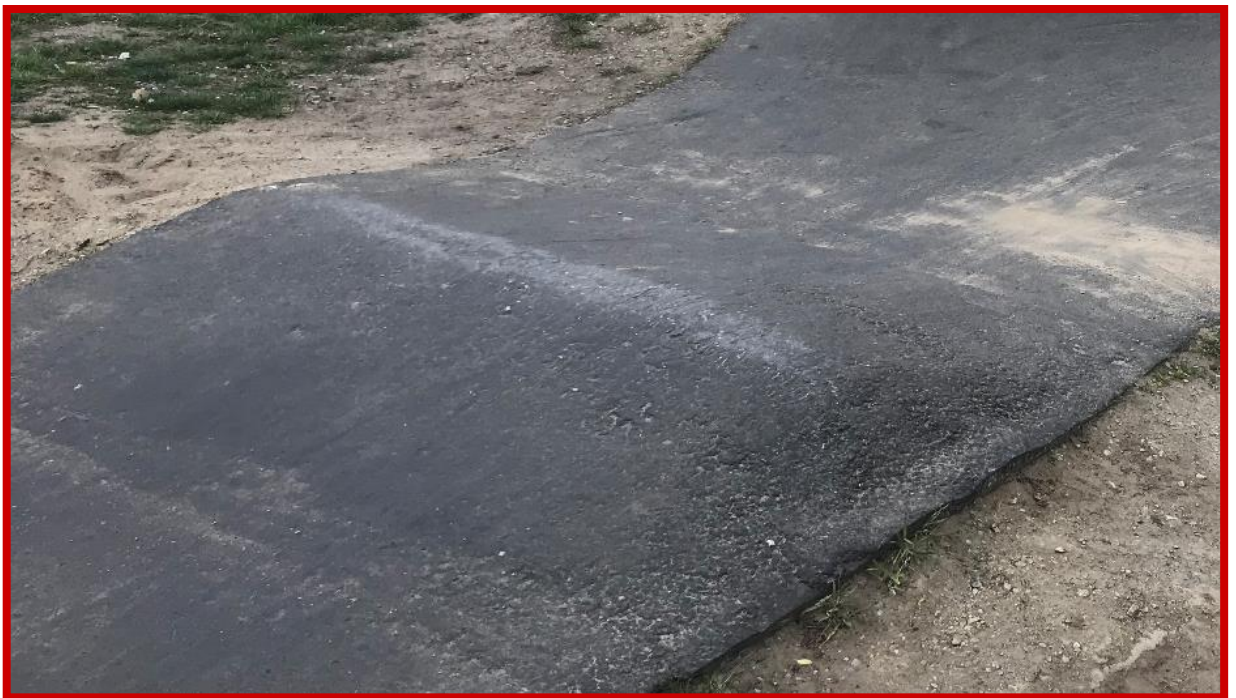
Niepoprawnie wykonany garb – o licznych nierównościach i złym kształcie

Wszystkie przeszkody wchodzące w skład rowerowego placu zabaw - PUMPTRACK (garby, muldy, przeszkody złożone itp.) muszą być wyprofilowane w taki sposób, aby umożliwiała płynną jazdę. Niedopuszczalne jest wyprofilowanie przeszkód wymuszających "nerwową jazdę" tzn. zbyt ostrych, o szpiczastych kształtach.